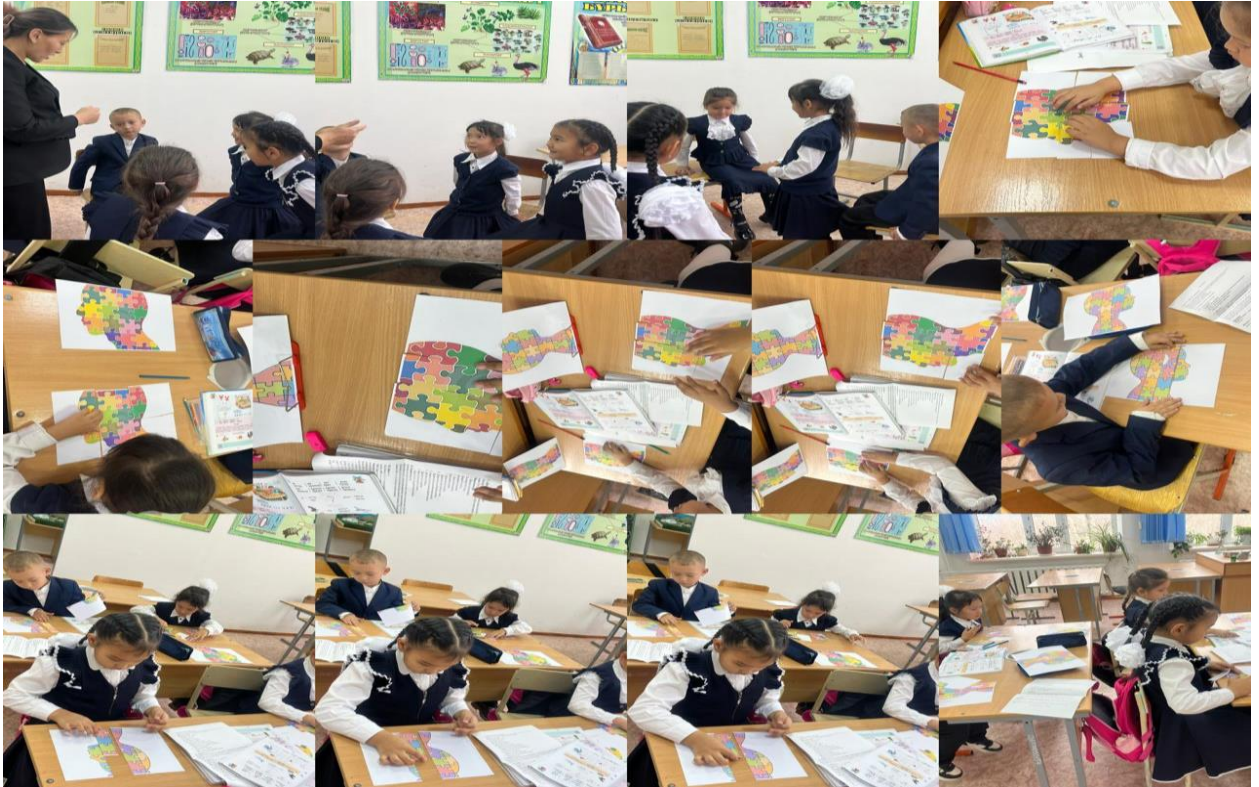
2-сынып оқушыларымен 10.11.2025ж «Күніне бір жақсы іс-үлкен жетістікке жол!» тренинг сабақ өткізілді.