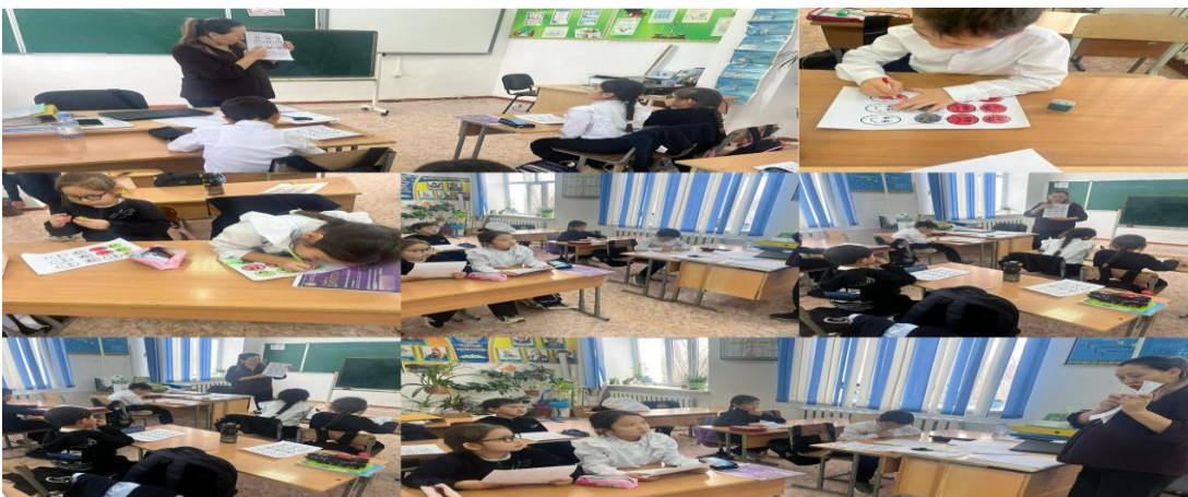
17.11.2025ж «Оқуға ынта-табысқа жол» 3-сынып оқушыларымен тренинг өткізілді.