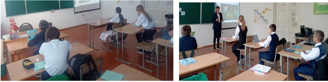
1-сынып оқушыларымен 03.11.2025ж «Мектеп-менің достарым мекені»атты тренинг өткізілді.